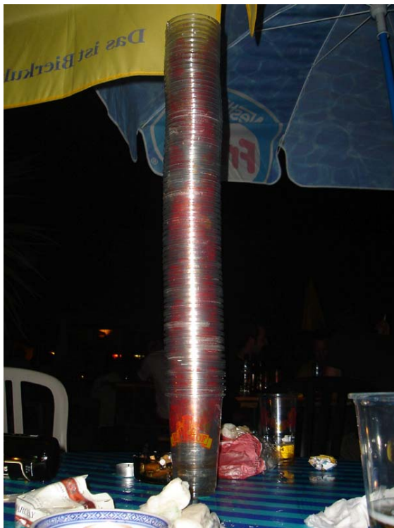
Es soll keiner sagen, die Unabhängigen seien nicht trinkfest..