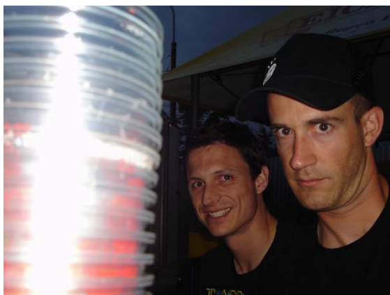
Julio-H. und Bisegger: Bald ausgemustert?