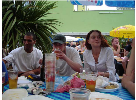
Eiferten alle nur Welz nach?